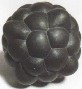
図録 / 直径約 20cm / 黒樹脂 / 2019

1977 群馬県美術科 (19 山崎記念特別賞) 1979 現代日本美術展 東京芸大大学院修了・京大大学院修了 1981 滝船歌謡 (1~27 池袋西武百貨店) 1982 第5回日本企業連邦作家展 (銀座和光) 1991 高崎市立美術館開館記念展出品 2002 第2回上毛芸術奨励賞受賞 2009 群馬の美術 1914~2009 2014 夢の軌跡「ぐんまの作家 59 人展」 2018 「井田淳一と生徒たち」展