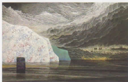
秋景画-舟の光 / 116.7x182cm / 麻紙・墨・顔料・金・漆・藍 / 2019

1959 長野県生まれ 1985 多摩美術大学大学院造形研究科修了 1992 セントラル美術館日本画大賞展 佳作賞 1999 第1回トリエンナーレ-豊橋入賞 (05.17) 2004 謝代日本絵画展 渡辺経記念文化協会賞 2012 群馬県展 山崎二記念特別賞 現在 群馬県展理事