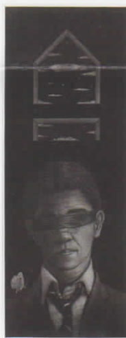
船の音が聞こえる / 315x22.0cm / メゾチント / 2019

1957 群馬県生まれ 1980 筑波大学芸術専門学群卒業 - 群馬県美術展 1986-日本海軍節展 (95 準会員、2008 会員) 1987-自由美術展 (09 会員、2014 平和賞) 1990 版画展の新人作家大賞展 (賞上賞) 2001 上毛美術展常賞 2002 群馬県美術展 (山崎記念特別賞) 2004 ふくみつ地方芸術振興大賞展 (銅版部門賞) 2016 群馬県市セミナリヨ現代版画展 (群馬県有賞) 2019 アワガミ国際ミニプリント展 (優秀賞)