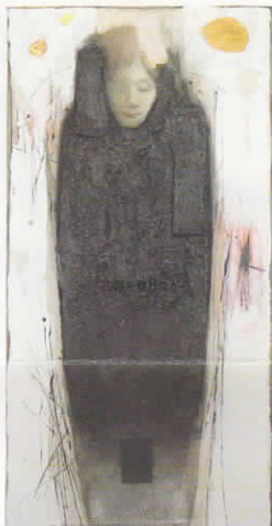
鏡り梅モモ / 113.5x59cm / ミューストメディア / 塩 / 2019

1957 前橋生まれ 1994 文化庁現代美術選抜賞 1995 文化庁芸術家在外派遣(イタリア) 1996 Napoli 個展 1999 昭和会展 (日仏美術財団賞) 2002 日本海軍節展 (07/11/14) 2011 昭和会賞作家選抜展 (東京日仏美術財団) 2017 前橋の美術2017 (アーツ前橋) 2018 二紀展 (文部科学大臣賞) 2022 前橋の美術2020 (アーツ前橋)