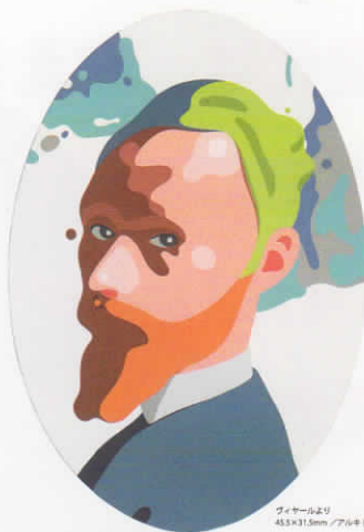
ヴィンセントより / 45.3x31.5mm / アクリル+鉛筆 / 2019

●1月25日(土) 16:00よりオープニングパーティを行います。気軽にお出掛け頂ければ幸いです。