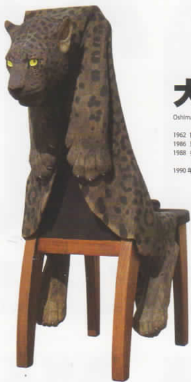
FADE FUR Cherno1-Fpantse- / 110x49x35cm / 麻、毛織物、絹、アクリル / 2019