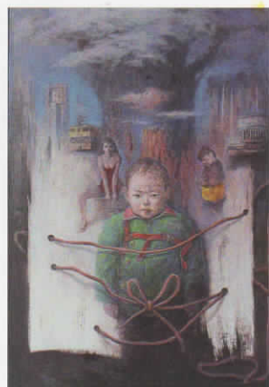
キミとレタマフコナエレ / 116.7x80.3cm / アクリル+油絵 / 2019

1958 群馬県出身 34 筑波大学芸術専門学群卒業 1994 「感動する人と自然大賞展」優秀賞 「上毛芸術奨励賞」受賞 200 「第35回昭和会展」招待出品 (06 第41回展) 2002 「第5回人間学大賞展」佳作賞 「第1回日本アートアワード」大賞賞入賞 2008 「第8回小嶋長平大賞展」入賞 2012 T2U8 (佳作賞) 2014 「夢の軌跡」群馬の作家 59 人展出品 現在 一般社団法人二紀協会員、群馬県美術協会理事