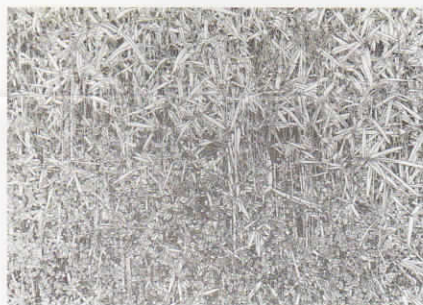
草のたより / 180x180cm / 坂本幸重 / 2019

1954 群馬県沼田に生まれる 1980 日暮屋 画廊入籍 1981 川崎彫刻に転身 1991 第11回山崎美術展 大賞受賞 1992 五島記念文化賞 美術新人賞受賞 1994 第24回日展 特選受賞 2003 日暮屋賞員 (09/12/17) 2011 群馬県美術展 山崎二記念文化賞 2015 個展 / 坂本幸重展 (高崎真島町) 日 2019 TOP RUNNER (高崎市タワー美術館) 現在 日暮屋特別会員 群馬県美術展常任理事