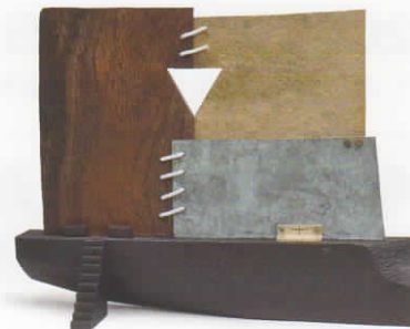
木 / 13x26x39cm / 木材、真鍮、銅、紙、布 / 2019